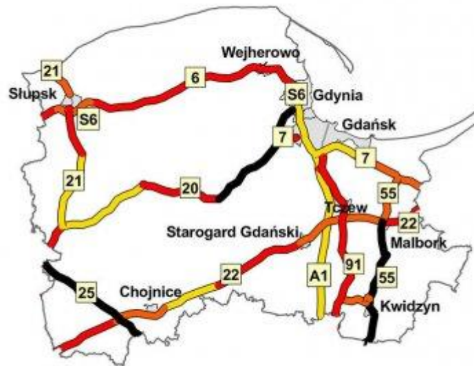
Mapa ryzyka indywidualnego na drogach krajowych w woj. pomorskim 2010-2012

Drogi krajowe zarządzane przez Generalną Dyрекcyję Dróg Krajowych i Autostrad (GDDKiA) w województwie pomorskim mają ok 0,9 tys. km. W badanym okresie (lata 2010-2012) na drogach tych miało miejsce 387 poważnych wypadków, w których zginęły 174 osoby, a 340 odniosło ciężkie obrażenia ciała.